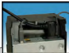
■ 紧凑设计为电缆接线