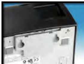
■ 容易安装的挂墙壁托架