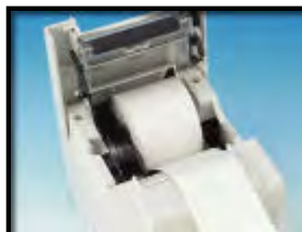
■ 58 毫米纸卷调节档板