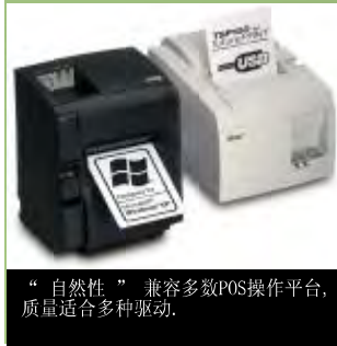
“自然性” 兼容多数POS操作平台，质量适合多种驱动。

用微软Windows XP 在2.3GHz 处理器、 512 MB 内存的 PC 上打印 80毫米宽X 150毫米长收据获得的结果。